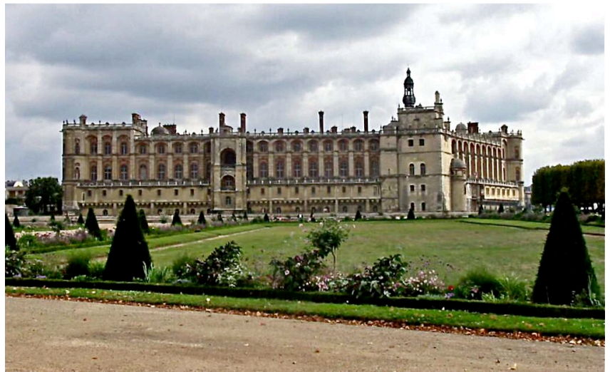
Château « historique » de Saint-Germain-en-Laye

Le samedi 28 septembre 2019 la Société d'Histoire et d'Archéologie du 13 e vous convie à une journée au coeur des boucles de la Seine