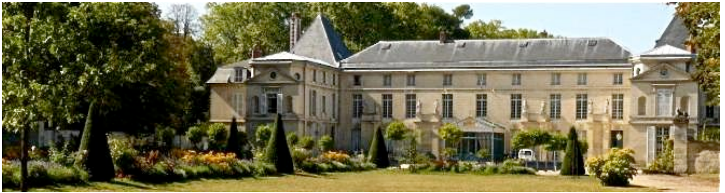
Malmaison (la « campagne » de Joséphine et de Napoléon Bonaparte)