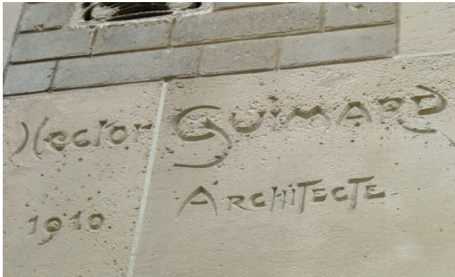
Une signature, un style unique, HECTOR GUIMARD

La Société d'Histoire et d'Archéologie du XIII e vous invite à vous inscrire à la BALADE-CONFÉRENCE « HECTOR GUIMARD AU VILLAGE D'AUTEUIL » MERCREDI 2 AVRIL 2025